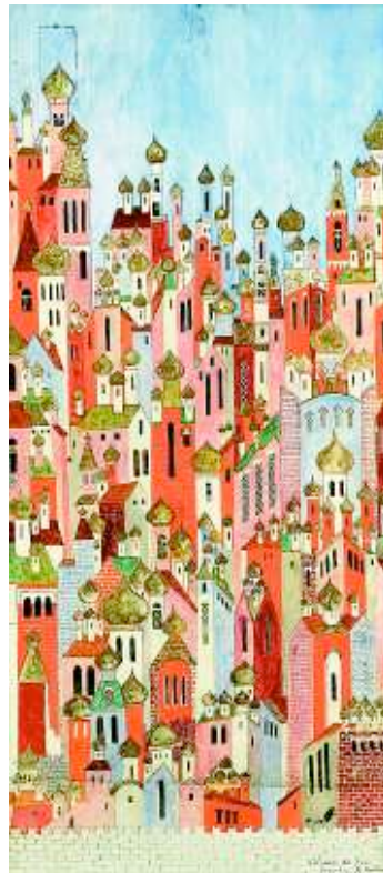
Наталья Гончарова. Эскиз декорации к балету Игоря Стравинского «Жар-птица». Галерея Sphinx Fine Art Russian, ярмарка Russian, Eastern & Oriental Fine Art Fair