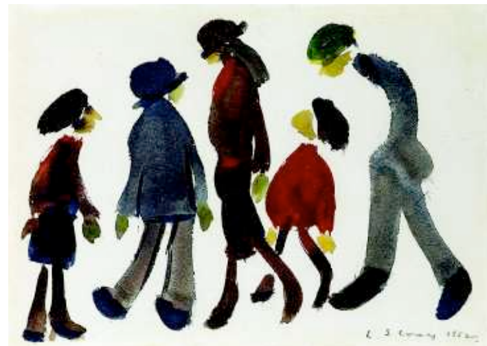
Лоуренс Лоури. «Пять фигур», середина XX века. Акварель. Галерея Stephen Ongpin Fine Art, ярмарка Art Antique London