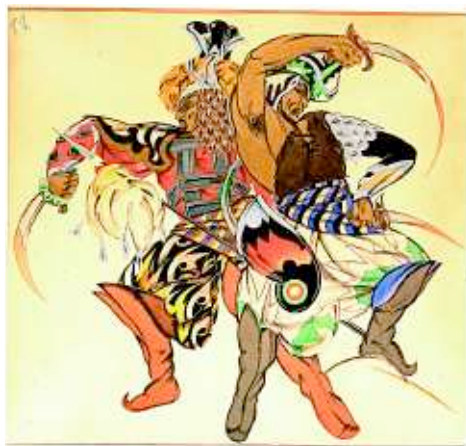
Георгий Пожедаев. Эскиз костюма к опере Александра Бородина «Князь Игорь». Галерея Chaucer Fine Art, ярмарка Russian, Eastern & Oriental Fine Art Fair