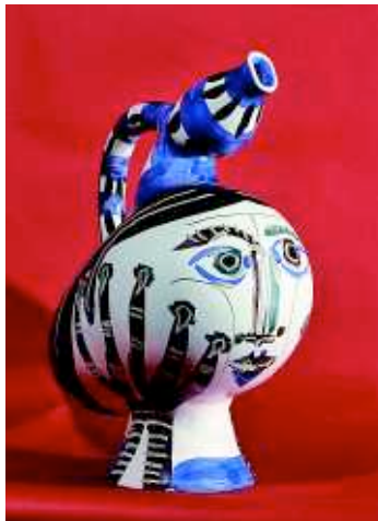
Пабло Пикассо. Декоративный сосуд, 1951 год. Jane Kahan Gallery, ярмарка Art Antique London