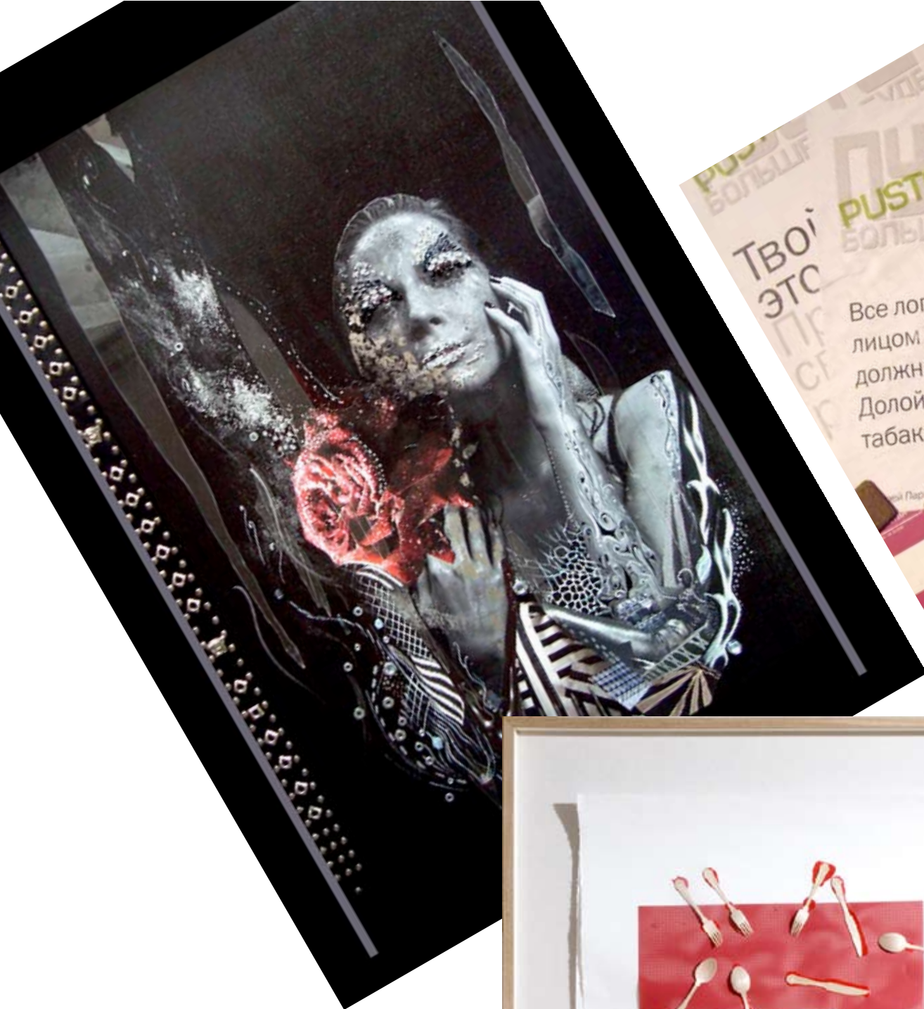
Дарья Семенова (1984 г. р.) «Красная роза»; 100 x 80 см; холст, масло.