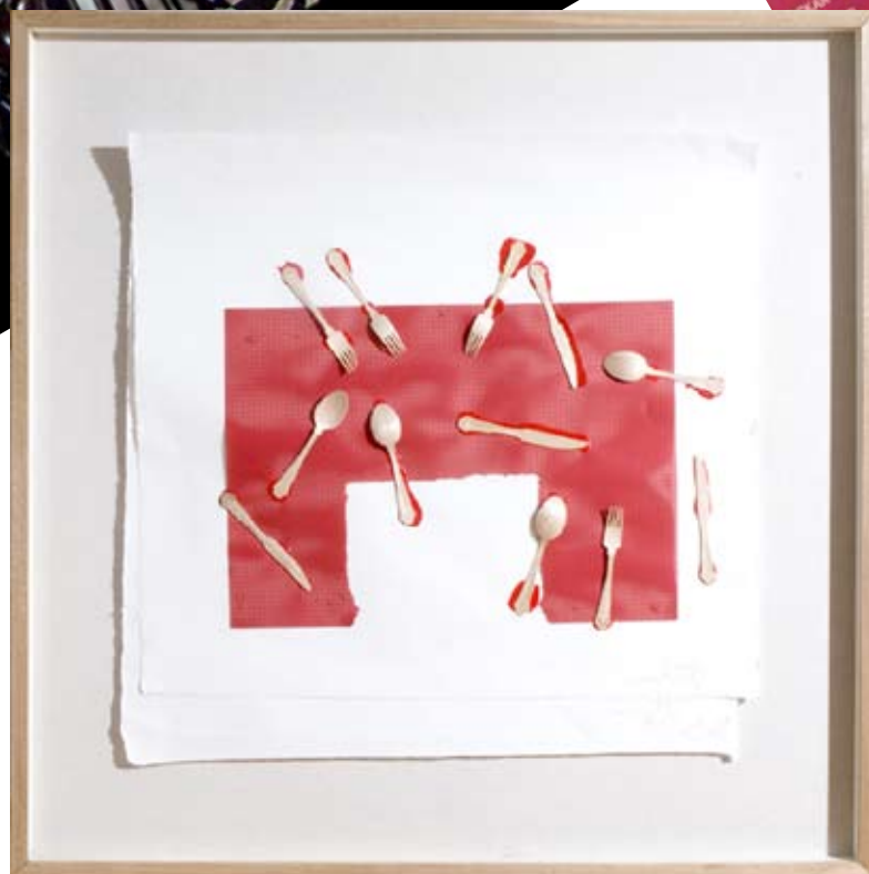
Ник Че (1985 г. р.) «NeoPepperstein»; 50 x 40 см; коллаж.